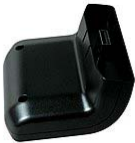
Optional GPS Antenne