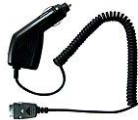
Ladegerät für Fahrzeuge